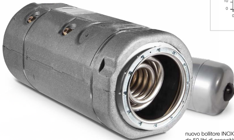
nuovo bollitore INOX aisi 316 da 50 litri di capacità

Produzione di A.C.S. in 10 minuti - Bollitore a 60°C Temperatura acqua ingresso 15°C