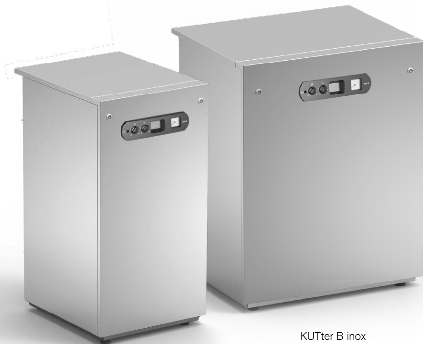
KUTter R inox