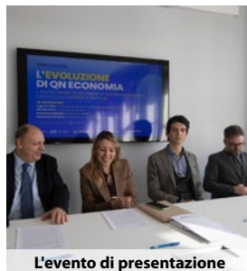
L'evento di presentazione

Gruppo Monrif presenta il nuovo "sistema" di QN Economia tra carta, digitale ed eventi; Speed si avvia verso una chiusura d'anno in pari